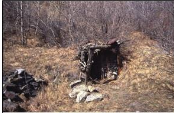
Entrée de mine paysanne à Puy St Pierre

Il s'agit de petites exploitations gérées par 2-3 personnes, en général des amis ou des parents. On en compte plusieurs centaines. Les méthodes d'exploitation y étaient très originales.