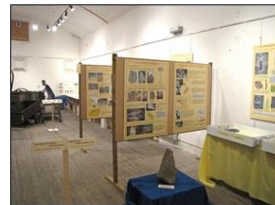
Le coin « géologie des terrains houillers ».