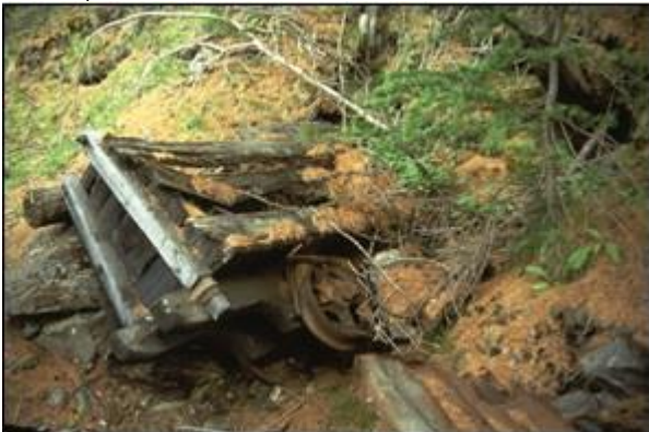
Un patrimoine oublié jusqu'en 1990

Les mouvements alpins ont plié et cassé les veines de charbon, rendant l'exploitation difficile et peu rentable. Pour cette raison, le bassin n'a jamais été nationalisé. C'est pourquoi, il y a peu, on y utilisait des méthodes originales et un outillage proche de celui qui était employé aux siècles précédents. De ce fait, les mines du Briançonnais sont de véritables « fossiles techniques », uniques en France et rare en Europe.