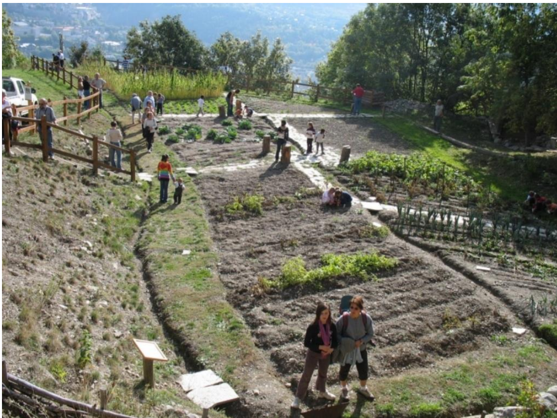
Le jardin des canaux en 2007