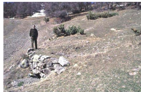
Four à chaux de la piste

* le « four du berger » qui réunit dans un petit périmètre, tous les éléments nécessaires à la fabrication de la chaux : pierre à chaux (la « pierre bleue »), charbon, eau.