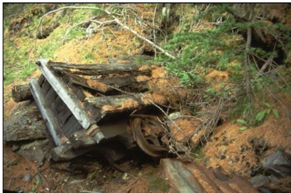
Un patrimoine oublié jusqu'en 1990

Les mouvements alpins ont plié et cassé les veines de charbon, rendant l'exploitation difficile et peu rentable. Pour cette raison, le bassin n'a jamais été nationalisé. C'est pourquoi, il y a peu, on y utilisait des méthodes originales et un outillage proche de celui qui était employé aux siècles précédents. De ce fait, les mines du Briançonnais sont de véritables « fossiles techniques », uniques en France et rare en Europe.