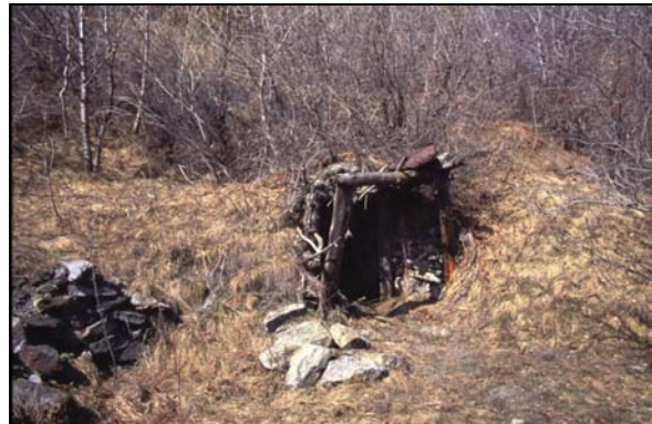
Entrée de mine paysanne à Puy St Pierre

Il s'agit de petites exploitations gérées par 2-3 personnes, en général des amis ou des parents. On en compte plusieurs centaines. Les méthodes d'exploitation y étaient très originales.