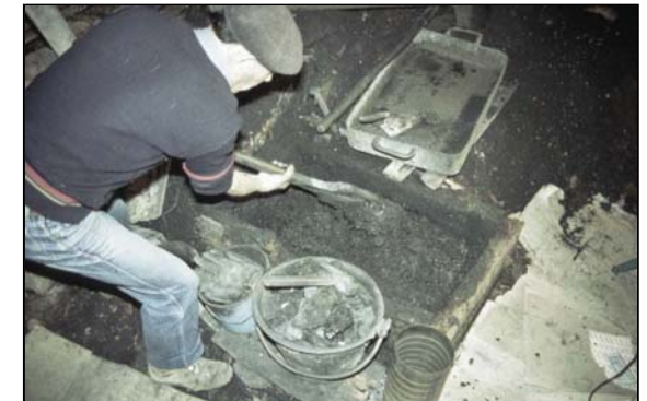
Fabrication du « pétri » : le pétri était un mélange de poudre de charbon (la « molle ») et d'eau. Il était enfourné dans les poêles.

En outre, l'association édite des publications, réalise des expositions et présente des conférences-diapos.