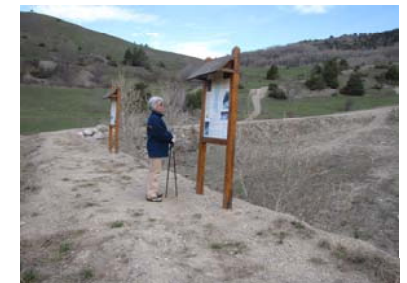
Un panneau du parcours

Le problème majeur des vallées alpines tient au fait que, faute de place, des habitations se sont implantées sur les cônes de déjection autrefois désertés par les habitants. Dans ces conditions, l' aléa naturel se transforme en risque .